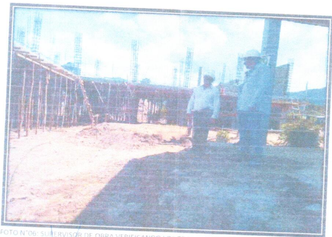
FOTO N°06: SUPERVISOR DE OBRA VERIFICANDO LOS TRABAJOS EJECUTADOS EN OBRA ACOMPAÑADO DEL RESIDENTE.