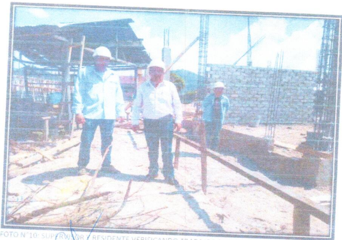
FOTO N°10: SUPERVISOR Y RESIDENTE VERIFICANDO TRABAJOS QUE SE VIENEN EJECUTANDO EN OBRA.