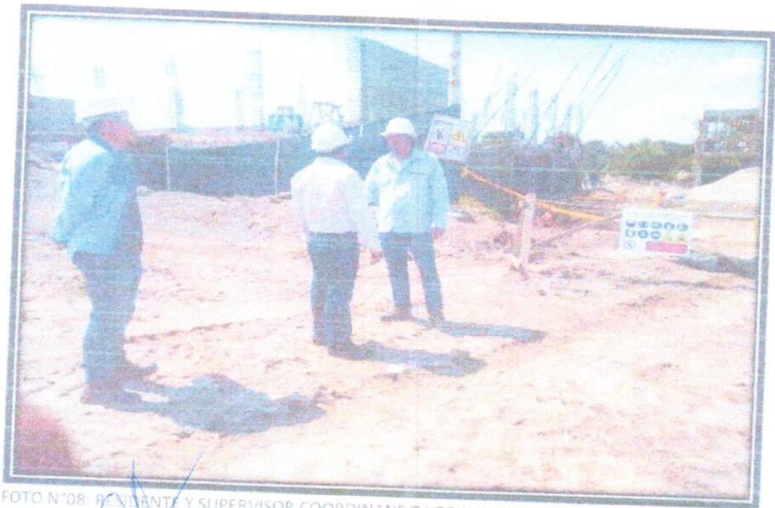
FOTO N°08: RESIDENTE Y SUPERVISOR COORDINANDO LOS AVANCES DE OBRA