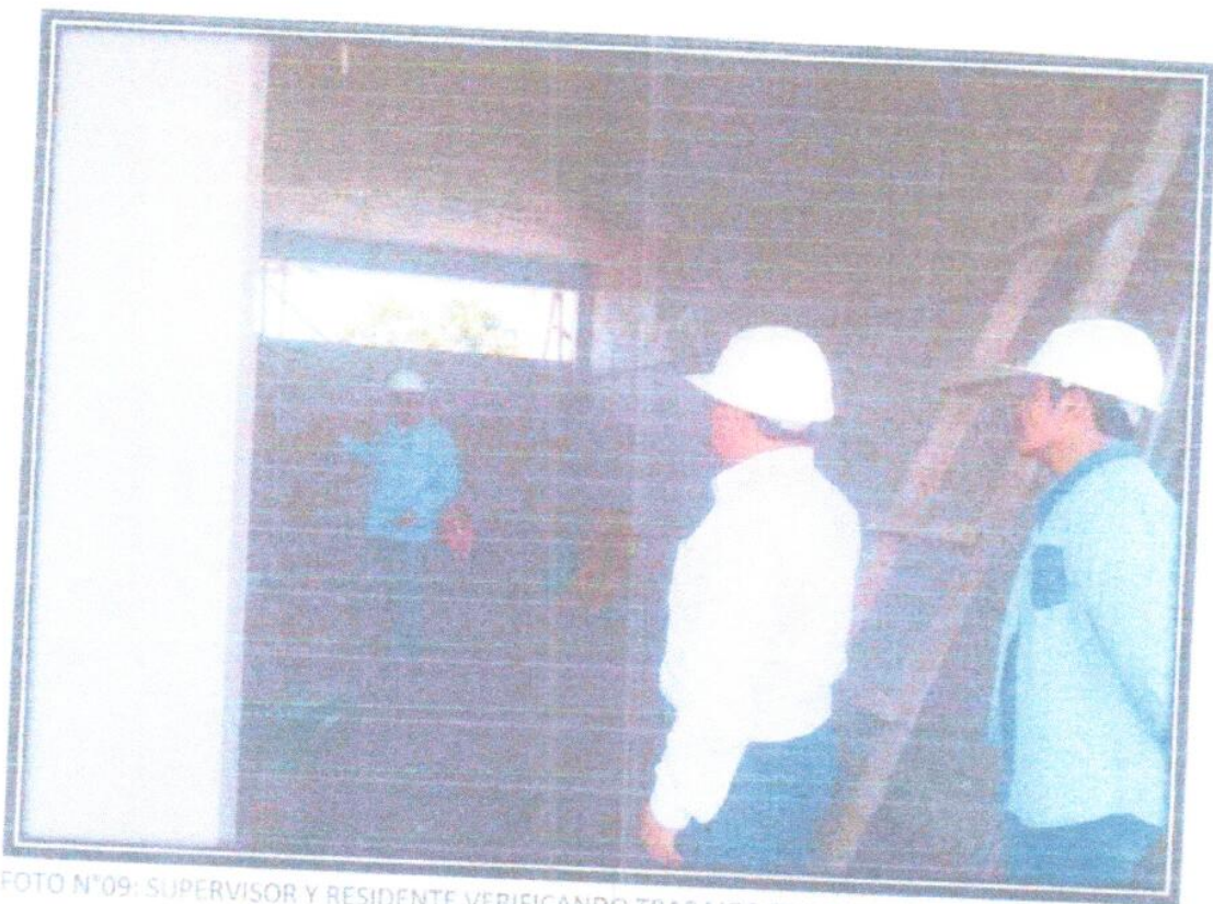
FOTO N°09: SUPERVISOR Y RESIDENTE VERIFICANDO TRABAJOS QUE SE VIENEN EJECUTANDO EN OBRA.